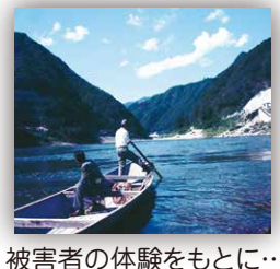
被害者の体験をもとに…