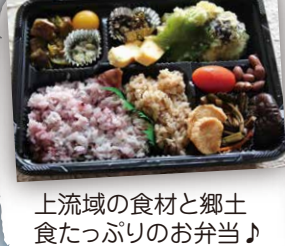
上流域の食材と郷土食たっぷりのお弁当♪