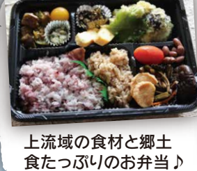
上流域の食材と郷土食たっぴりのお弁当♪