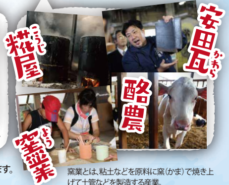
窯業とは、粘土などを原料に窯(かま)で焼き上げて土管などを製造する産業。