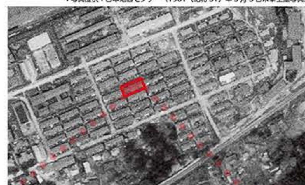
▲「ハーモニカ長屋」と呼ばれた住宅

工場のまわりには、働く人たちが家族として住むための住宅のほか、デパートや映画館、プールや幼稚園などができて、都会のようになりまして。