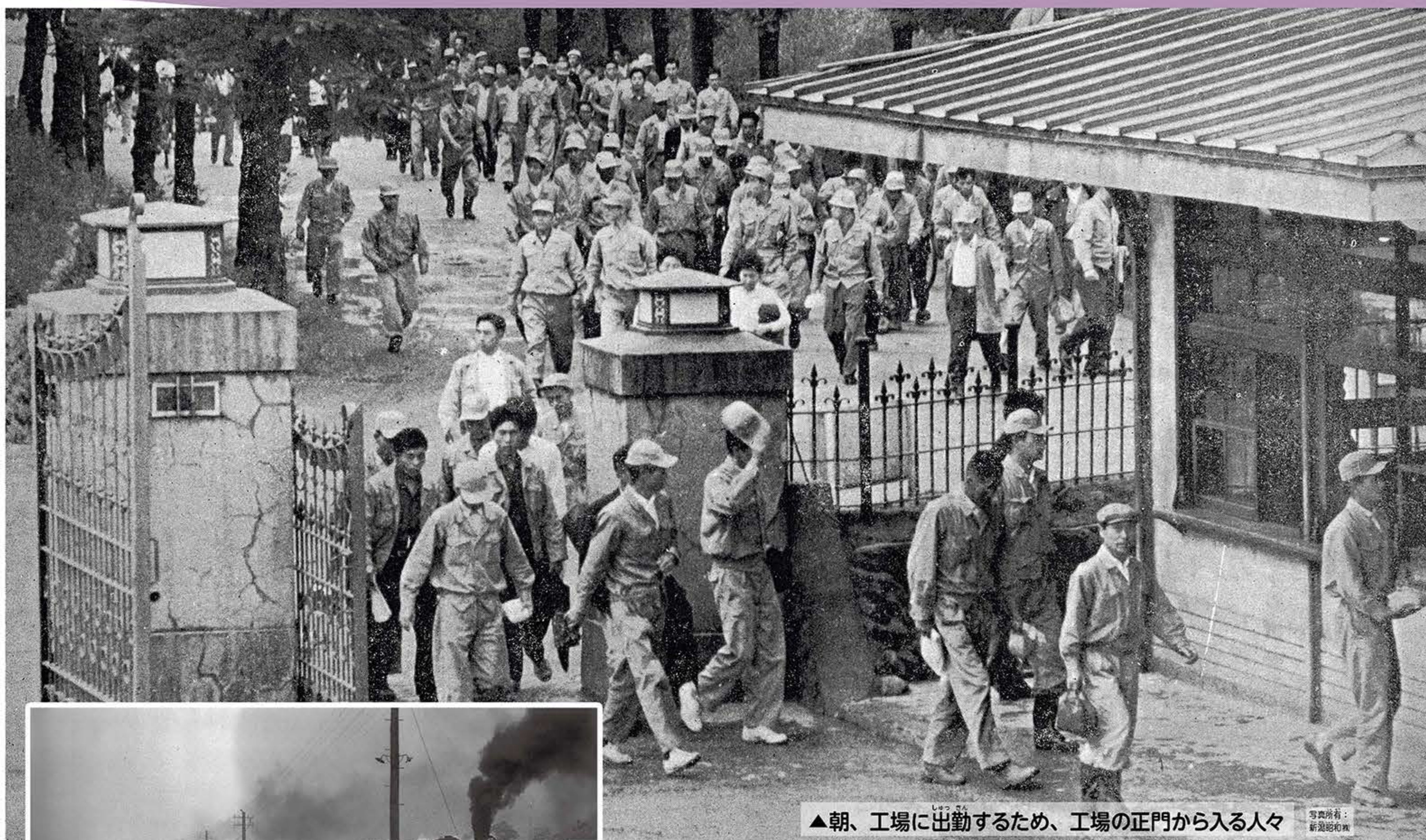
▲朝、工場に出勤するため、工場の正門から入る人々