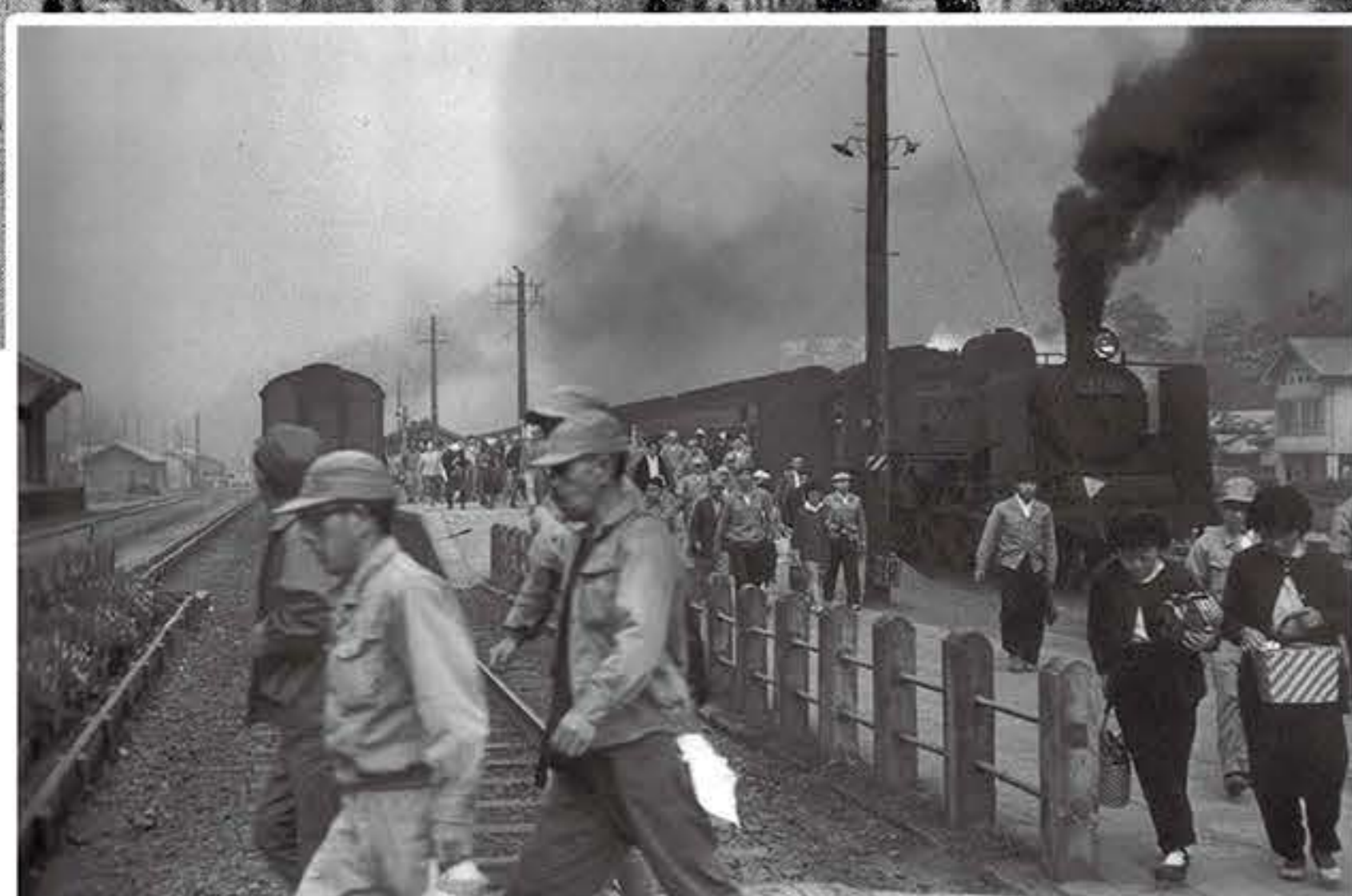
▲朝、工場に出勤する人々で混み合う鹿瀬駅