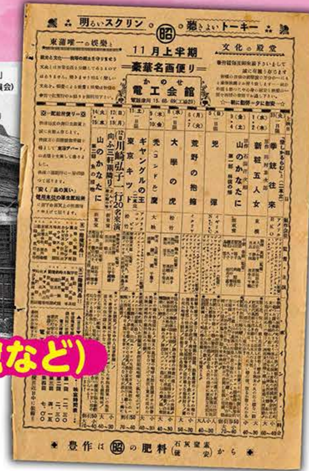
▲当時の上映スケジュールのチラシ