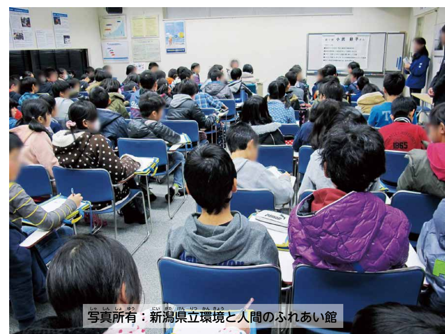
▲語り部の話を聞いている様子

「かん きょう 環境と人間のふれあい館」は、にい がた けん 新潟県が運営するにい がた みな また びょう し りょう かん 新潟水俣病の資料館です。被害 者の語り部のお話を聞いたり、てん じ ぶつ 展示物などを見学したりすることができます。