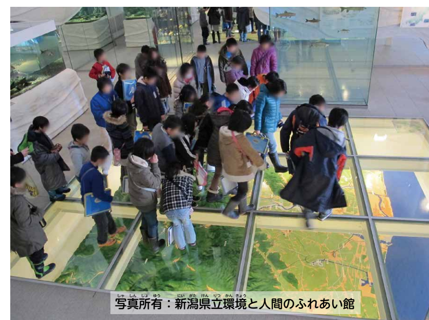
▲館内の展示を見学する様子

かん きょう 環境と人間のふれあい館は、 どこにあるか、わかりますか？ 地図を真上から、 ながめてみましょう！