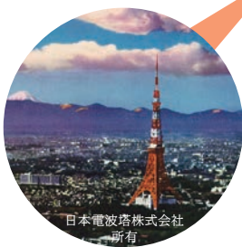
昭和30~40年代の日本を振り返る