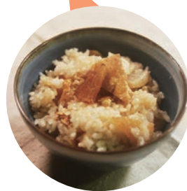
豪華な粗食「蒸しかまど炊き込みご飯と糍弁当」