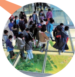
新潟水俣病資料館の館内展示案内など