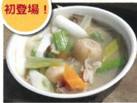
帛乙女たっぷり さといも汁