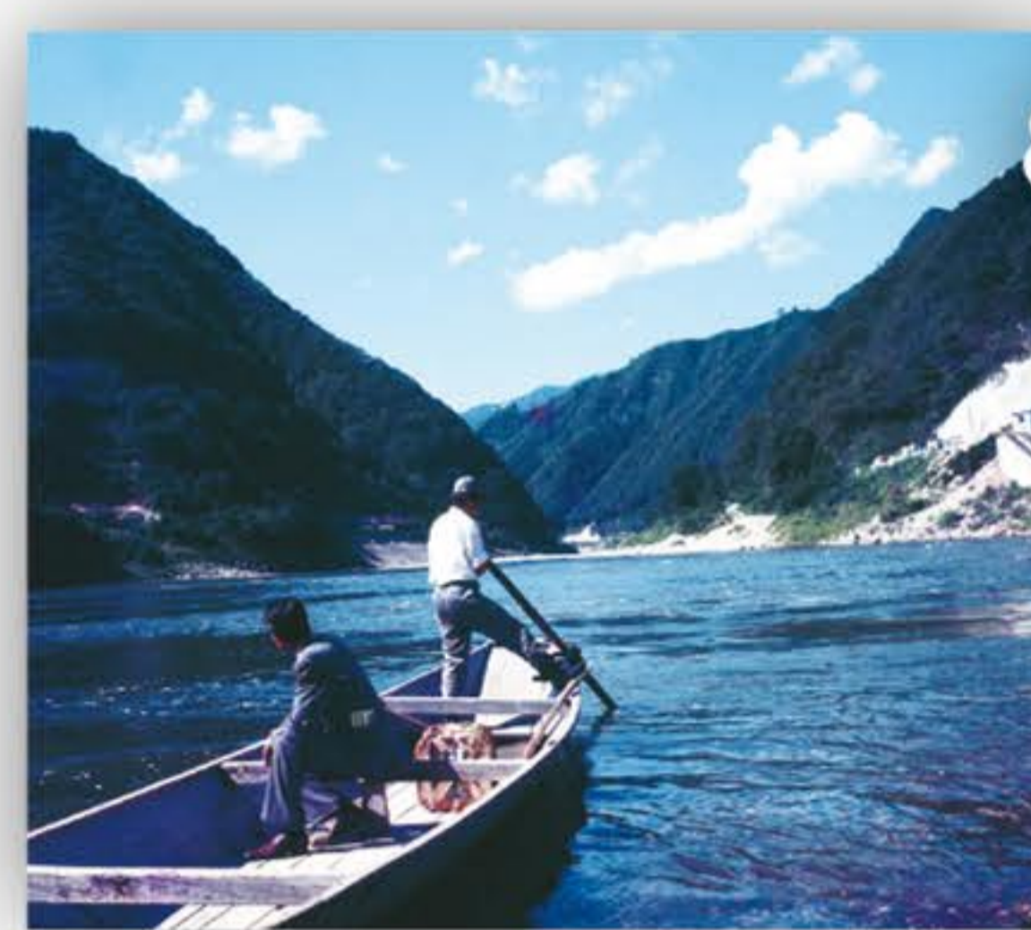
元・船頭さんのお話。