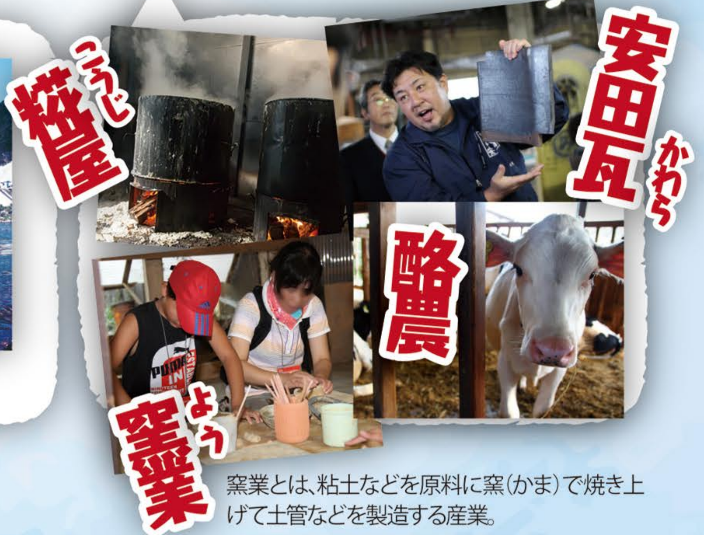
窯業とは、粘土などを原料に窯(かま)で焼き上 げて土管などを製造する産業。