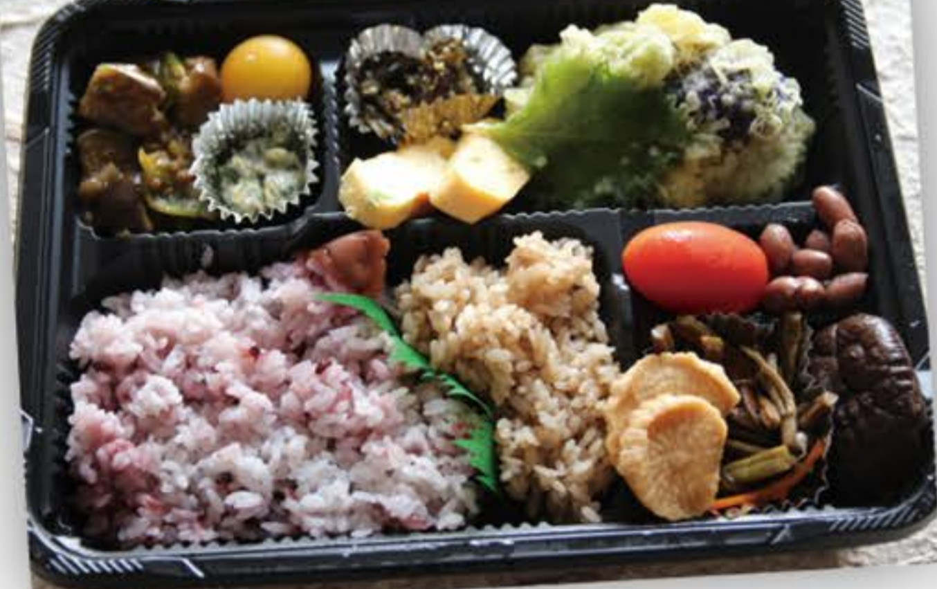
上流域の食材と郷土 食たっぴりのお弁当♪