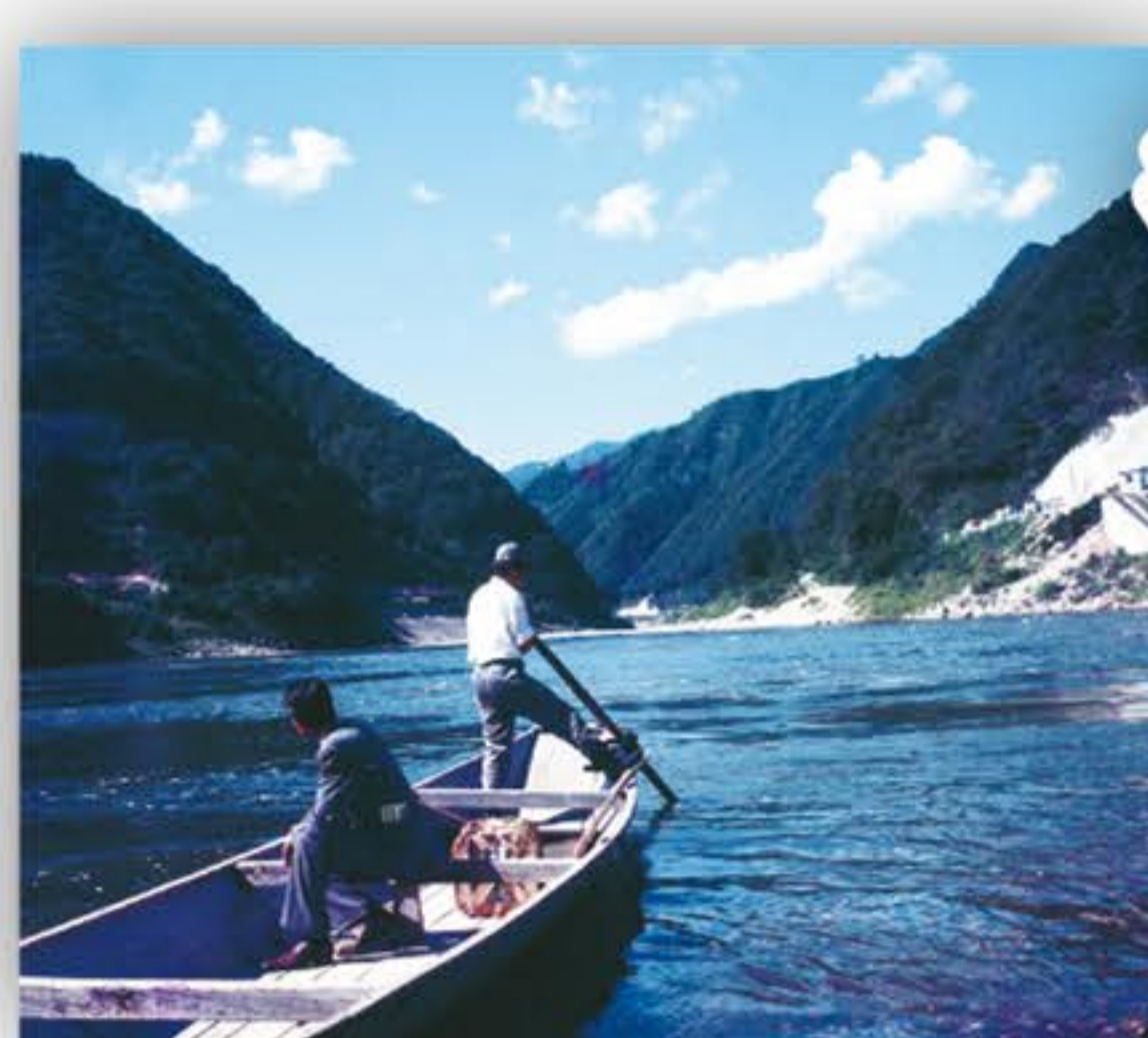
元・船頭さんのお話。