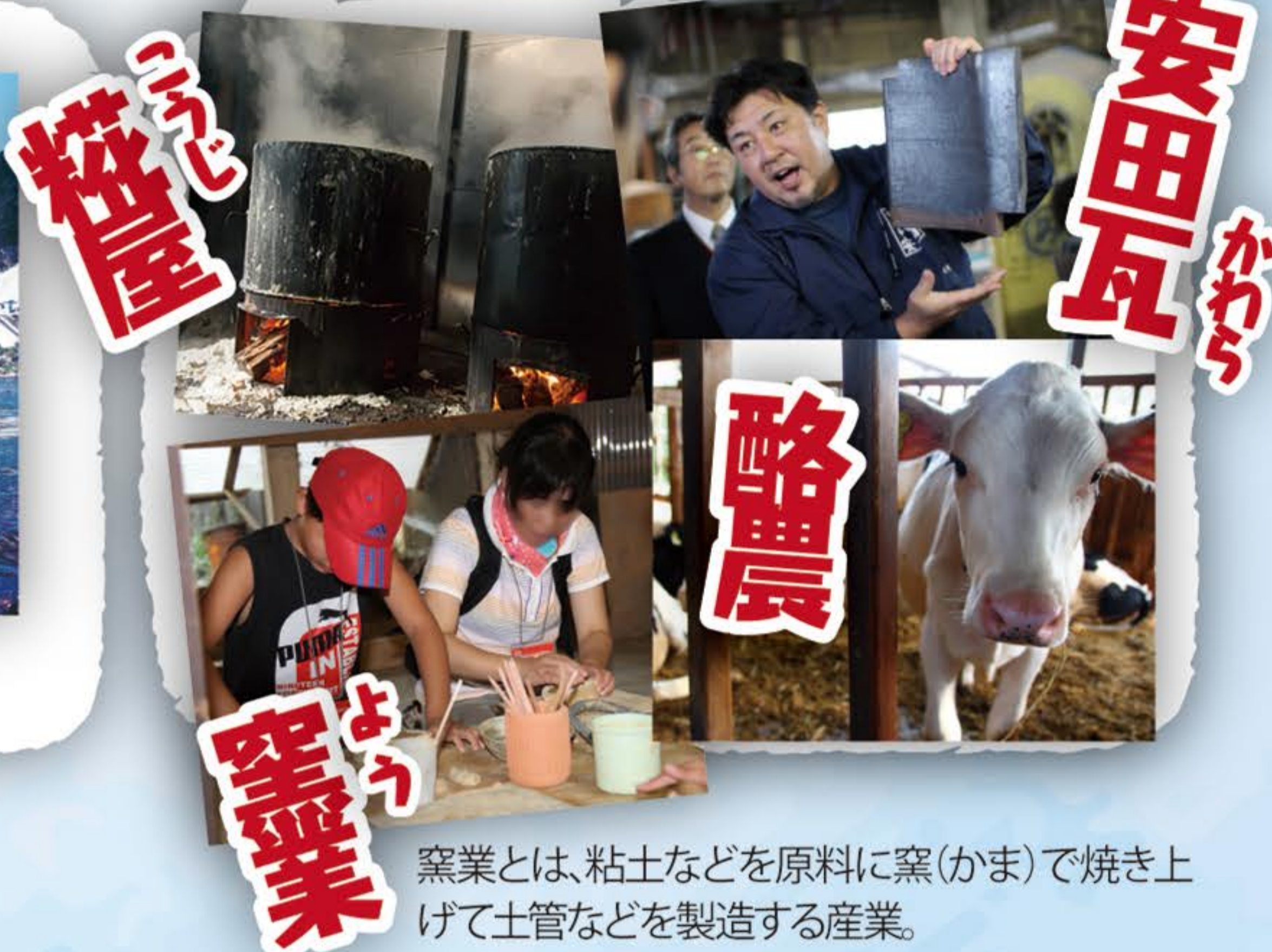
窯業とは、粘土などを原料に窯(かま)で焼き上 げて土管などを製造する産業。