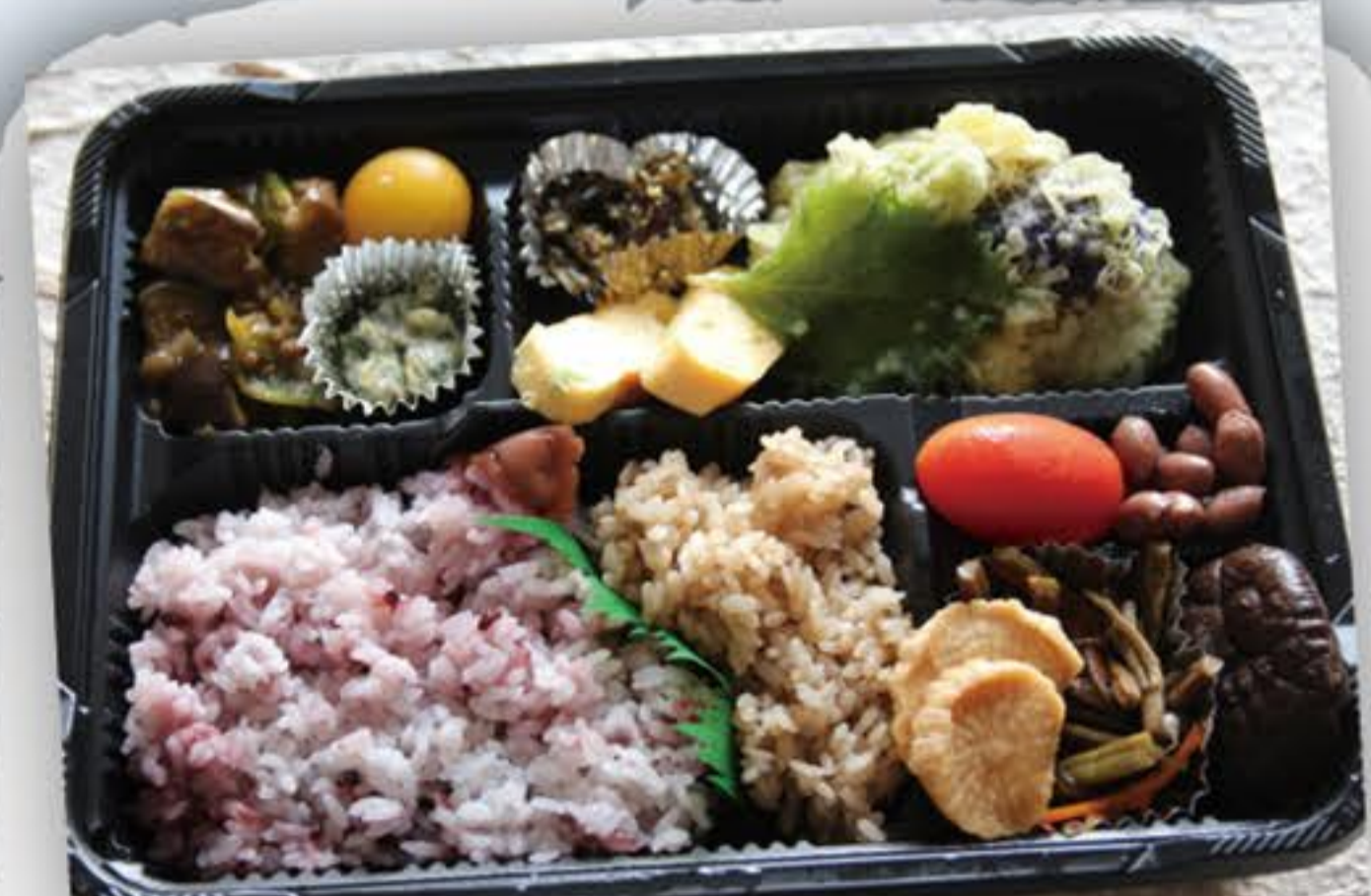
上流域の食材と郷土 食たっぴりのお弁当♪