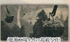
(鹿瀬工場タムス掲載写真)

オプション プログラム 持倉銅山探索プログラム 希望者のみ参加。ただし、このプログラムのみの参加は不可。 【900に道の駅みかすに集合/別途参加費1,500円/定員20名】