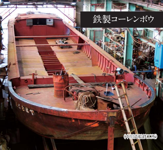
鉄製コーレンボウ