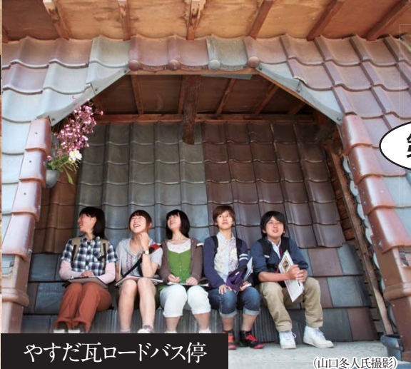
やすだ瓦ロードバス停