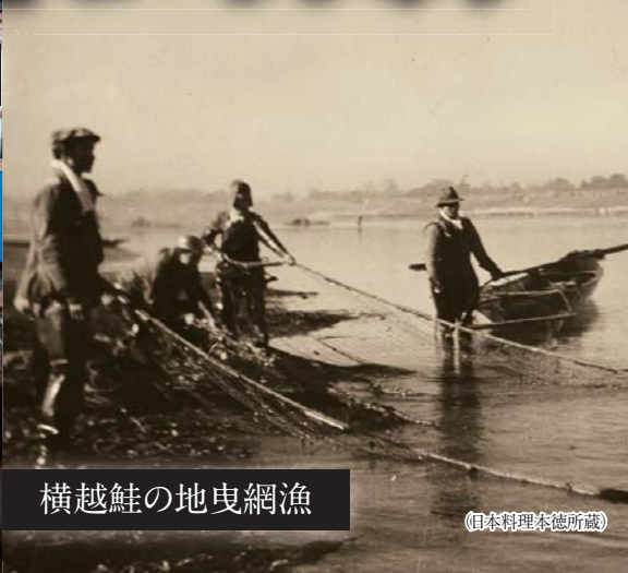
横越鮭の地曳網漁