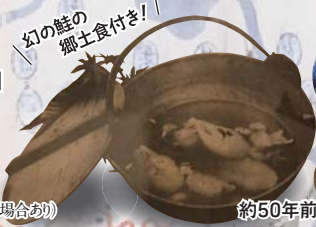
約50年前の鮭の納屋煮

豪華な粗食 「日本料理本徳」 当日のみの特別メニュー 横越鮭の 午餐コース (※当日内容が一部変更になる場合あり)