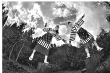
2013年最優秀賞 「天にも昇るよ」 渡辺 陸様