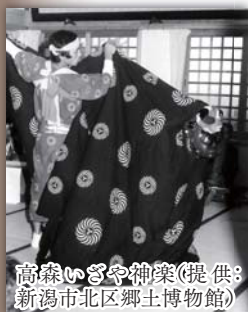
高森いざや神楽