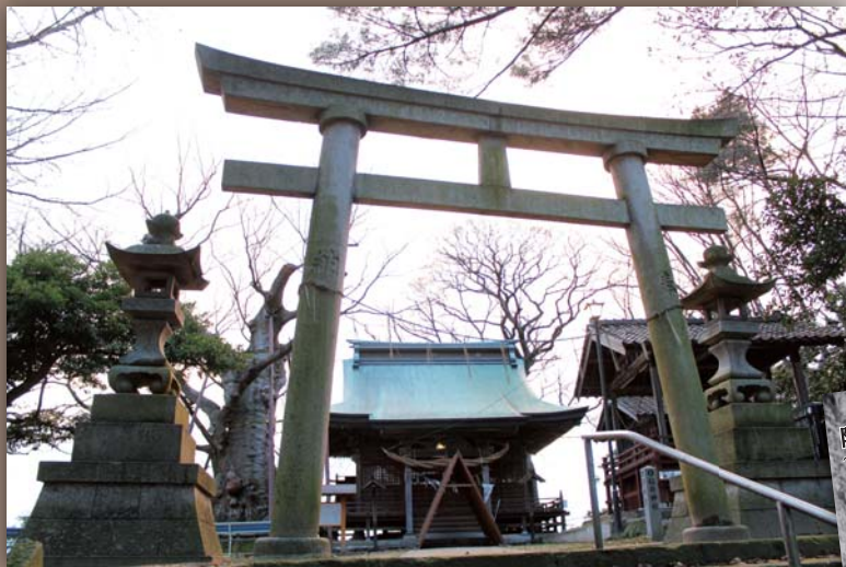
高森の大ケヤキと稲荷神社