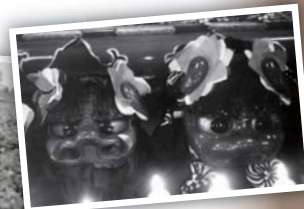
高森いざや神楽