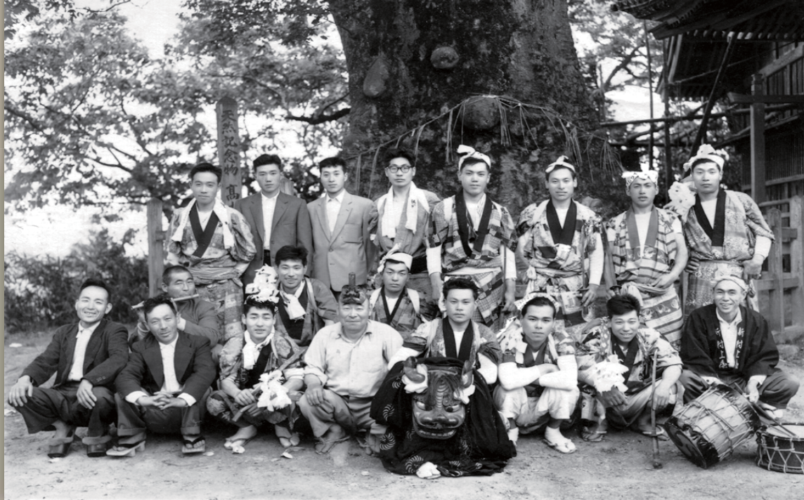
高森の大ケヤキの前で記念撮影(昭和20年代初め/提供:品田幸一氏)