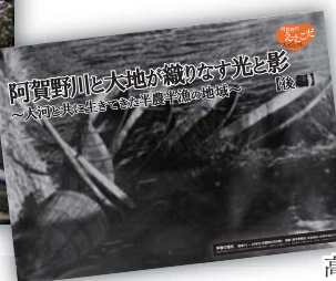
高森の畑

地域の方々からお貸いただいた写真や資料を基に、地元の皆さんと一緒に、地域の歴史の光と影を振り返る講座です。ぜひご参加願います！