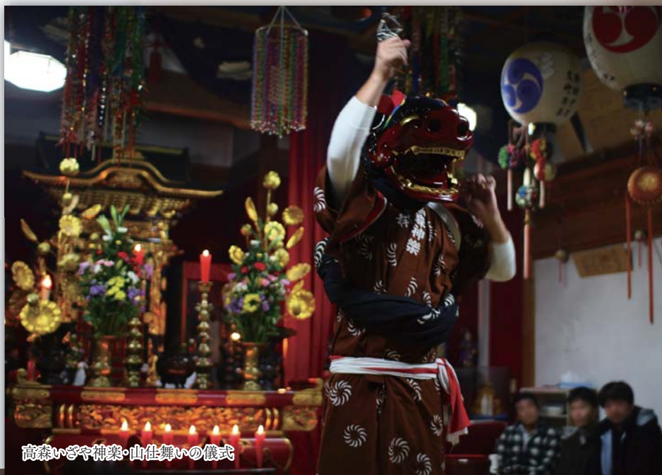
高森いざや神楽・山仕舞いの儀式

新潟水俣病の発生を境に失われ始めた「人と人の絆」「人と自然の関係」を再び紡ぎ直していくために、平成19年から官民協働で展開する「公害に向き合い乗り越えるための流域づくり」