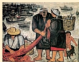
小島丹彦《昼(漁港)》1974年 (新潟市新津美術館蔵)