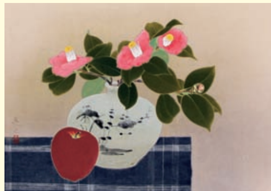
長井亮之《椿と林檎》(一般財団法人 北方文化博物館蔵)

後援 | 朝日新聞新潟総局、毎日新聞新潟支局、読売新聞新潟支局、産経新聞新潟支局、NHK新潟放送局、BSN新潟放送、NST、TeNYテレビ新潟、UX新潟テレビ21、NCV新潟センター、エフエムラジオ新潟、FM PORT79.0、FM KENTO、ラジオチャット・エフエム新津、エフエム角田山ぼかぼかラジオ