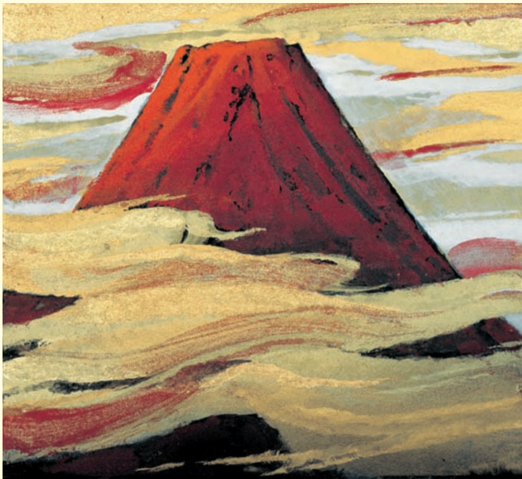
横山操《富士山》1966年(新潟県立近代美術館・万代島美術館蔵) ©Motoko Yokoyama 2013/JAA1300226