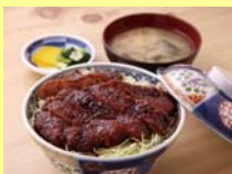
ソースかつ丼(イメージ)