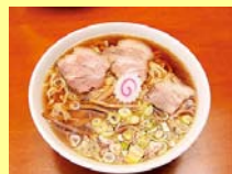
喜多方ラーメン(イメージ)