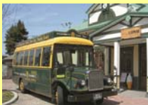
まちなか周遊バス「ハイカラさん」(イメージ)