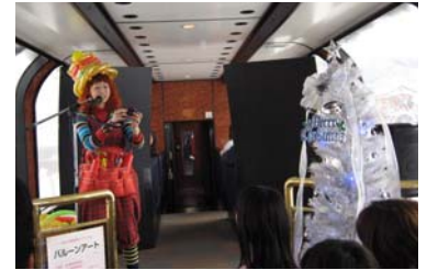
展望車イベント(イメージ)