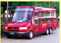
まちなか周遊バス「あかべえ」(イメージ)

※ご利用方法などの詳細は共通クーポンを引換えの際にお渡しする専用ガイドブックをご覧ください。