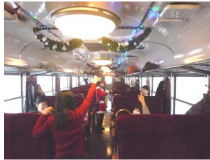
じゃんけん大会(イメージ)