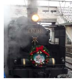
ヘッドマーク(イメージ)