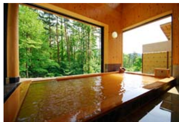
かのせ温泉赤湯 風呂の一例(イメージ)