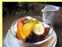
まち歩きスイーツ(イメージ)