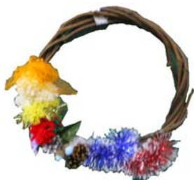
クリスマスリース(イメージ)

【往路】新潟駅 SLクリスマスストrein 津川駅 送迎バス かのせ温泉 昼食・入浴・リース製作・スイーツ 9:43 発 11:14 着 11:40 頃～16:40 頃 【復路】かのせ温泉 送迎バス 津川駅 SLクリスマスストrein 新潟駅 16:40 頃発 17:34 発 19:00 着