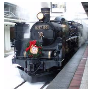
SLクリスマストレイン(イメージ)