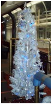
クリスマスツリー(イメージ)