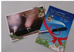
クリスマスカード(イメージ)