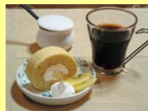
まち歩きスイーツ(イメージ)