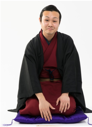
糸ちご亭越後屋さん