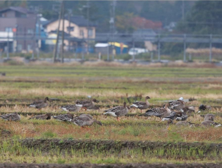
オオヒシクイ (福島潟周辺)

この冬も白鳥たちが新潟にやってきた！ ラムサール条約登録湿地・瓢湖（阿賀野市）と、 オオヒシクイの日本最大の越冬地・福島潟（新潟市）の2つの湖と、その間の田んぼをめぐるぜいたくコース。 生きものたちの冬の暮らしをのぞきにでかけましょう。